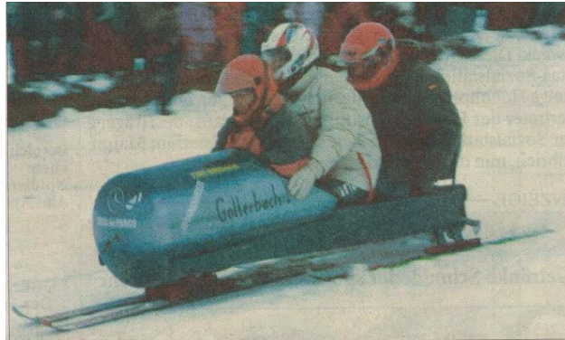
Einen windschnittigen Bob schickte der SC Gollerbach auf die Reise. Statt Kufen wurden wegen des Tiefschnees Ski montiert.

Vielfältig die Schlitten-Modelle: Da gab es ein Himmelfahrtskommando, einen römischen Streitwagen natürlich ohne Pferde, rasante Bobs, flitzende Hirschen und Stock-Cars, einen Steinzeit-Schlitten der Familie Feuerstein und sogar die Nachbildung eines Feuerwehrautos, erstellt von drei Nachwuchskräften der FFW Langeneck im Alter von 13 bis 15 Jahren. Denen klebte das Pech auf den Füßen, weil es schon im Training auf eisiger Piste ihr Gefährt in Einzelteile zerlegte. Nach einer harten Reparatur über Nacht konnten sie zwar starten, fuhren dann aber gegen einen Traktor. Verletzt wurde zum Glück niemand.