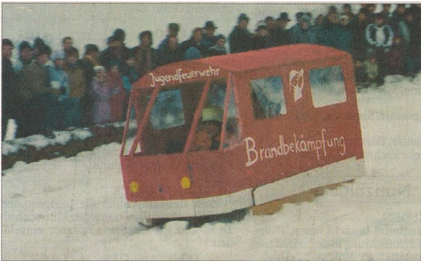
Mit allerlei technischen Problemen zu kämpfen hatten die Jungfeuerwehler aus Langeneck in ihrem Einsatzwagen.